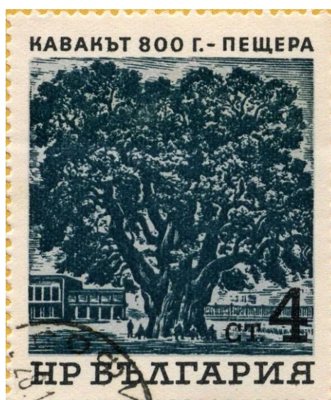
Старый 800-летний тополь

В той части «Одиссеи», где путешественники посещают страну лестригонов ( извл. 6 ), речь идет, как предполагается, о северных «белых ночах». В эпизоде о киммерийцах, по нашему мнению, отражены даже смутные представления о длинной (многомесячной) полярной ночи ( извл. 8 ). Интересно описание располагающейся на краю света, у входа в царство мертвых, «Персефониной рощи» (Персефона – владычица мертвых, жена Аида): образована она ивами ( Salix L. ) и черными тополями (возможно, Populus nigra L. ), произрастающими, как и положено этим представителям семейства ивовых, на низких влажных местах ( извл. 7 ). Хотя и с большой натяжкой, мы позволим себе считать данный фрагмент первым известием о флоре Северной Евразии.