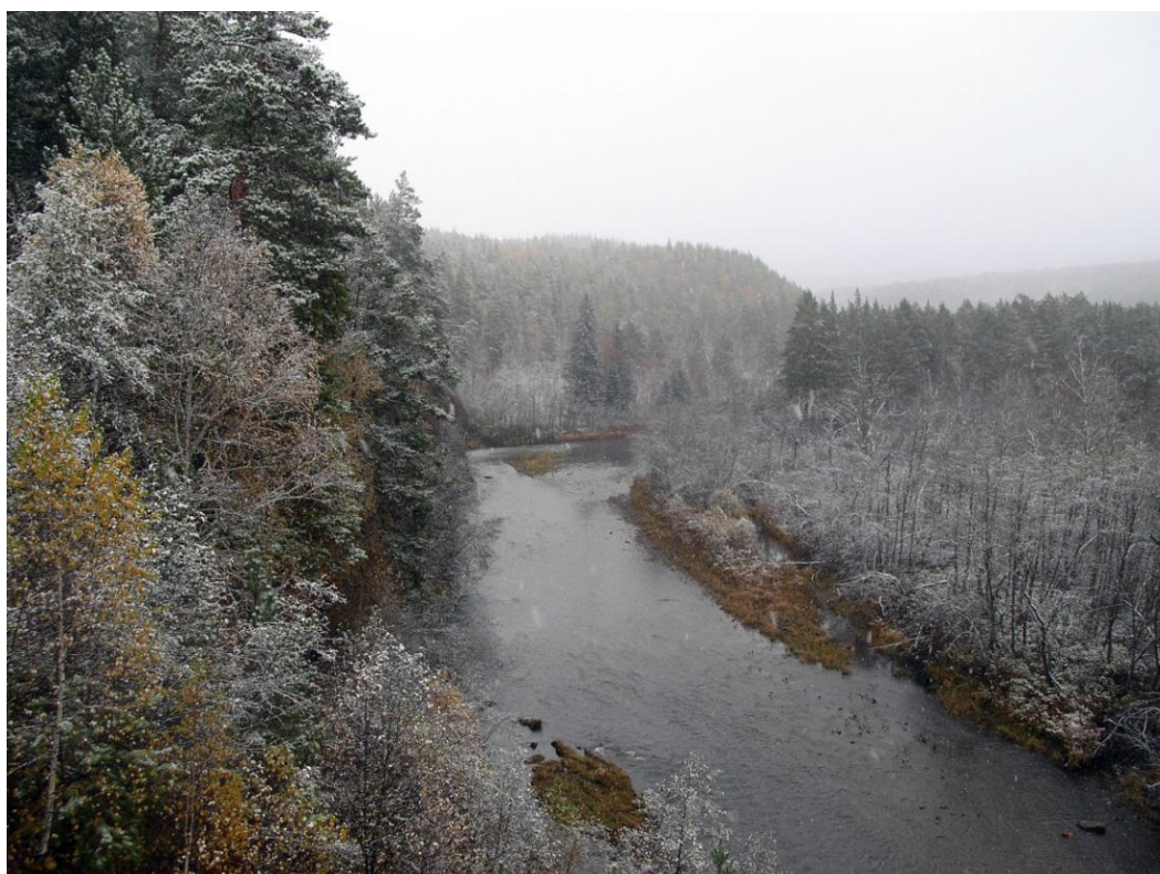
Густые туманы и облака, согласно Гомеру, окутывают северные страны (вверху – хребет Северный Крак, внизу р. Бол. Инзер, Белорецкий район РБ).